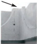
Prolunga doppio inc. con impronta a semicerchio